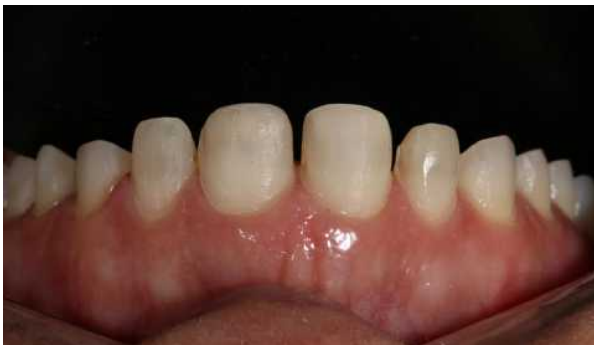
Figura 4 D - Preparos após a remoção das provisórias.