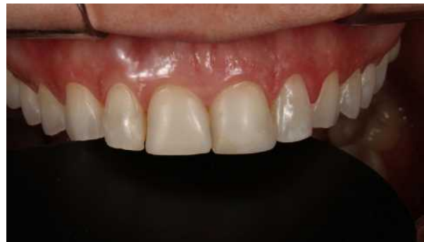
Figuras 2: Pormenor dos dentes anteriores.