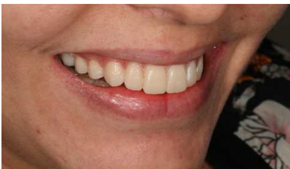
Figura 3 - Após enceramento diagnóstico, foi feita a simulação com resina bisacrílica. Dessa forma é possível nessa fase avaliar e conversar com o paciente sobre os aspectos de alteração de forma e tamanho.